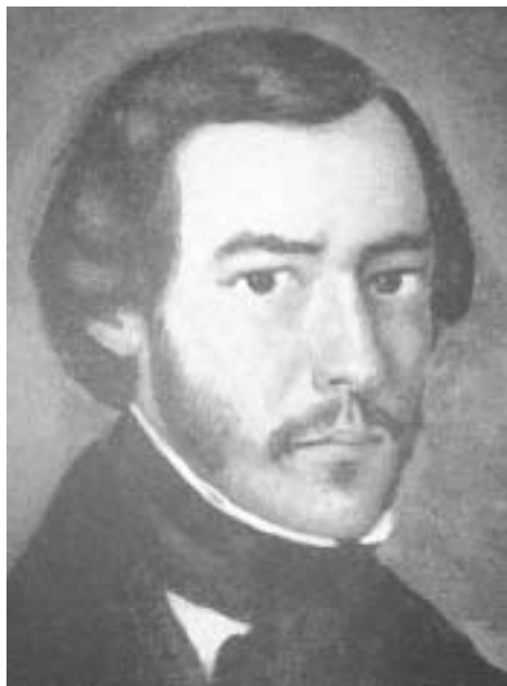
Fig 1 : Brown-Séquard jeune