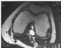
Fig. 1b. - Coupe transversale.

On demande d'emblée une IRM sans avoir de diagnostic précis à évoquer. Cet examen permet de découvrir un kyste de la synoviale du ligament croisé postérieur (fig. 1a, b et c).