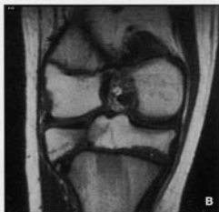
Fig. 3. - A) Traumatisme de l'extrémité supérieure du tibia. Aspect de décollement épiphysaire Salter I. B) IRM effectuée chez le même patient, montrant l'existence d'une fracture de type Salter IV associée.

contreuse d'une biopsie ne résoudra pas facilement le problème, car les aspects microscopiques d'un processus de régénération et de réparation peuvent être difficiles à différencier d'une lésion maligne.