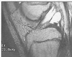
Fig. 1a. - Coupe sagittale.

L'examen clinique ne met en évidence aucune boiterie; le saut unipodal est possible, indolore et stable; le genou est sec, stable dans les plans frontal et sagittal. On ne retrouve aucun point douloureux que ce soit sur les trajets ligamentaires ou au niveau de l'interligne articulaire et on ne perçoit aucun kyste poplité à la palpation.