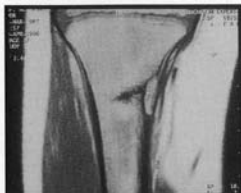
Fig. 2. - Fracture de fatigue.

Les fractures occultes (« bone bruise ») sont typiquement localisées à proximité des articulations et n'ont pas de traduction radiologique (sur les clichés simples ou sur un examen TDM). Elles consistent en des fractures microtrabéculaires sans effraction corticale. Elles sont secondaires à des forces de compression ou