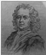
Fig. 2. - Hermann Boerhaave de Leyde (1668-1738).

On remarque dans les grands os qui sont joints à d'autres par une articulation mobile, par exemple, dans l'os de la cuisse, que les deux extrémités sont distinguées du reste du corps de l'os; ce qui s'apperoit très-clairement dans les os des enfans nouveau-nés ou des avortons. Car ces os n'ont été d'abord que des cartilages, & c'est dans le milieu de leur longueur qu'a commencé à paraître un petit grain osseux et rond qui s'étendant assez promptement de chaque côté dans toute la longueur, change le cartilage