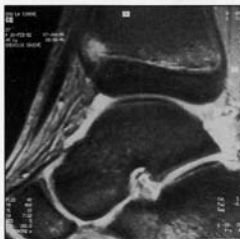
Fig. 3. - Fracture concernant la virole péri-chondrale de type Ogden 6.

le plan horizontal. En période secondaire, elle apprécie l'aspect d'un pont d'épiphysiosé et son volume. Elle a cependant l'inconvénient, tout comme la radiographie standard et la tomographie, de ne pas visualiser les structures cartilagineuses. Elle reste donc d'indication limitée.