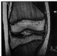
Fig. 1. - Ménisque discoïde congénital.

Les fractures de stress sont réparties en fractures de fatigue (par contraintes répétées ou inhabituelles sur un os normal) et en fractures par insuffisance osseuse (par contraintes normales chez l'enfant (ostéoporose, insuffisance rénale, fragilité osseuse constitutionnelle...). Les clichés simples peuvent mettre en évidence une réaction périostée focale, fine ou épaisse, une zone de condensation endo-osseuse (à condition que la lésion survienne sur une zone comportant de l'os spongieux) et, parfois, une solution de continuité linéaire sur la corticale. La scintigraphie est toujours positive. L'anamnèse et le tableau radiologique permettent le diagnostic dans la plupart des cas. Le piège réside en fait lorsque le diagnostic n'a pas été évoqué. Si une IRM est pratiquée, il faut savoir reconnaître les signes d'une fracture de fatigue et les différencier de ceux d'une tumeur ou d'une infection. Il n'y a pas de syndrome de masse des parties molles, tout au plus un œdème mal limité; il existe un œdème médullaire avec prise de contraste, une apposition périostée linéaire dont l'épaisseur dépend de l'ancienneté du traumatisme et un trait cortical est visible. La pratique molen-