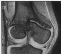
Fig. 4. - Aspect en IRM d'un pont d'épiphysiodèse fémoral inférieur.