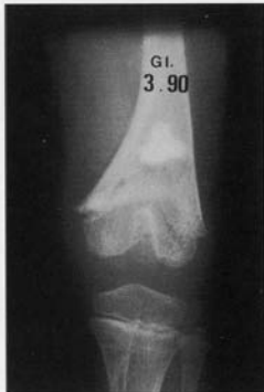
Fig. 5. - Aspect radiographique 3 ans après une désépiphysiodese fémorale inférieure. L'ascension relative du matériel d'interposition objective la reprise de la croissance osseuse.

du cartilage de croissance, la morphologie anormale de l'épiphyse, l'angulation et le raccourcissement sont autant de critères faciles à déterminer. La déformation des lignes d'arrêt de croissance métaphysaires qui vont converger vers le pont d'épiphysiodese, constitue un argument important confirmant le caractère définitif de ce pont et l'impossibilité de rupture spontanée par la poussée du cartilage de croissance restant. Ces éléments radiographiques vont imposer un bilan d'imagerie aussi complet que possible afin d'approcher au mieux l'importance du pont d'épiphysiodese et établir une prévision de l'inégalité et d'angulation en fin de croissance. L'IRM, la tomoscintigraphie sont alors des examens précieux renseignant non seulement sur le pont d'épiphysiodese mais aussi sur la valeur fonctionnelle du cartilage de croissance restant. À côté de cet aspect strictement morphologique et fonctionnel, l'utilisation des abaques de prévision d'inégalité de longueur des membres inférieurs va permettre une estimation de l'inégalité finale.