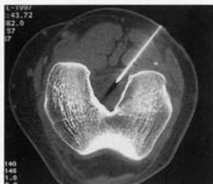
Fig. 2. - Injection du kyste avec guidage sous scanner.

La flexion du genou gauche n'est pas limitée mais est sensible dans les derniers degrés. Les radios standard de face et de profil du genou sont normales.